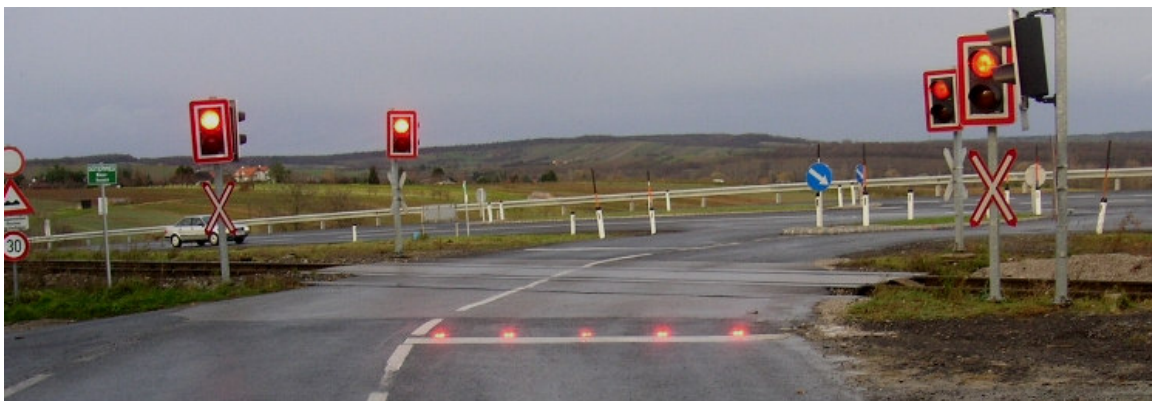
ISIS-EK Lane-Lights 1

Unter Umständen hätte gerade der Signaleffekt der roten LED- Lane-Lights die Aufmerksamkeit erhöhen und diesen Unfall verhindern können.